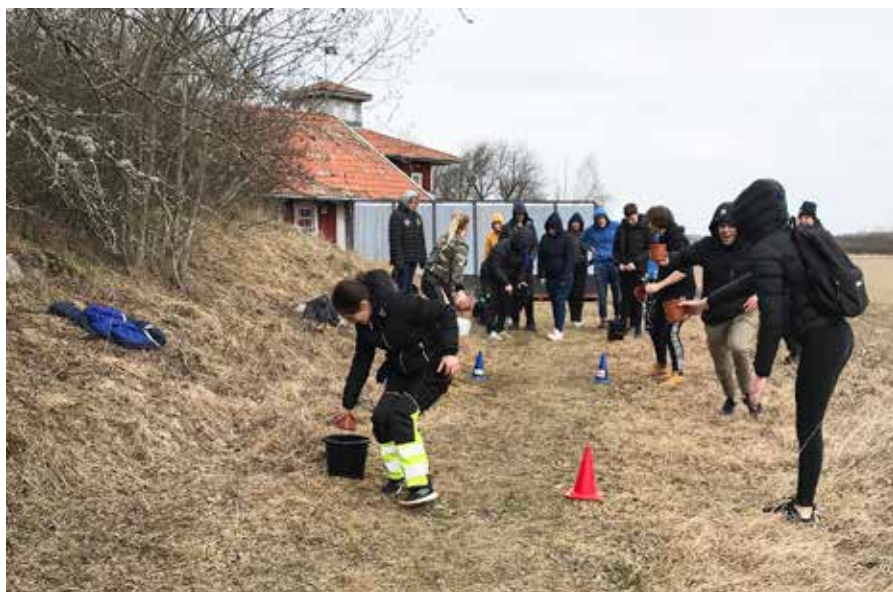
Här gör eleverna en övning där de ska få insikt om hur mycket energi det går åt vid tillverkning av en hamburgare av kött och en vegoburgare.

Se tillhörande tabell över förmågorna på nästa sida.