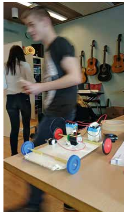
Full fart i klassrummet!

Vi har lyckats köpa in material som annars skulle vara knepigt att lösa rent ekonomiskt. Vi har en halv klassuppsättning LEGO mindstorms EV3 robotar, fina pneumatiksatser, flera bränslecellsbilar, 3D-skrivare, 3D-scanner...the list goes on - just tack vare LKAB. Enkelheten i att ha egna