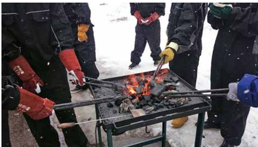
Smid medan järmet är varmt!

Under de fyra år som jag har eleverna i Teknik försöker jag variera mina examinationsformer ganska så kraftigt. Allt från diskussioner i små till stora grupper, egna redovisningar av fysiska och/eller digitala modeller, skriftliga prov, inlämningsuppgifter och ritningar, debatter till korta elevföreläsningar om t.ex. tekniska system. Alla dessa tillfällen är utmärkta för elevbedömningar.