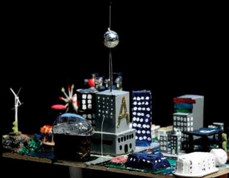
Vinnare Future City Modell: Säbyskolan, Rönninge

Future City 2016/2017 kommer att fokusera på de som staden är till för – invånarna. I staden bor det alla sorters människor. Unga och gamla, stora och små, långa och korta. Future City Minecraft handlar om att bygga det framtida Kiruna och vi kommer använda Lantmäteriets Sverigekartor att utgå ifrån. Uppgiften i Future City Uppsats handlar hur det är att vara ung i framtidsstaden. Vad händer med en stad om ungdomarna är i fokus? Läs mer och anmäl er på futurecity.nu