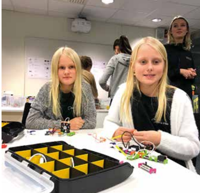
Aktivitet på Flygvapenmuseum i Linköping.

Vi arbetar med två delverksamheter. Den ena verksamheten gäller för våra medlemmar. Girls in STEM riktar sig till tjejer inom grundskolan (främst mellanstadiet) som vi ordnar roliga aktiviteter för. För att bevara intresset fokuserar vi på