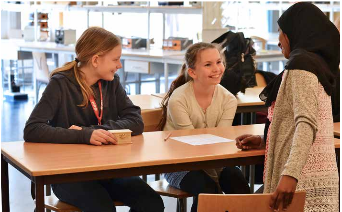
Fler tjejer behöver lockas till tekniksektorn.