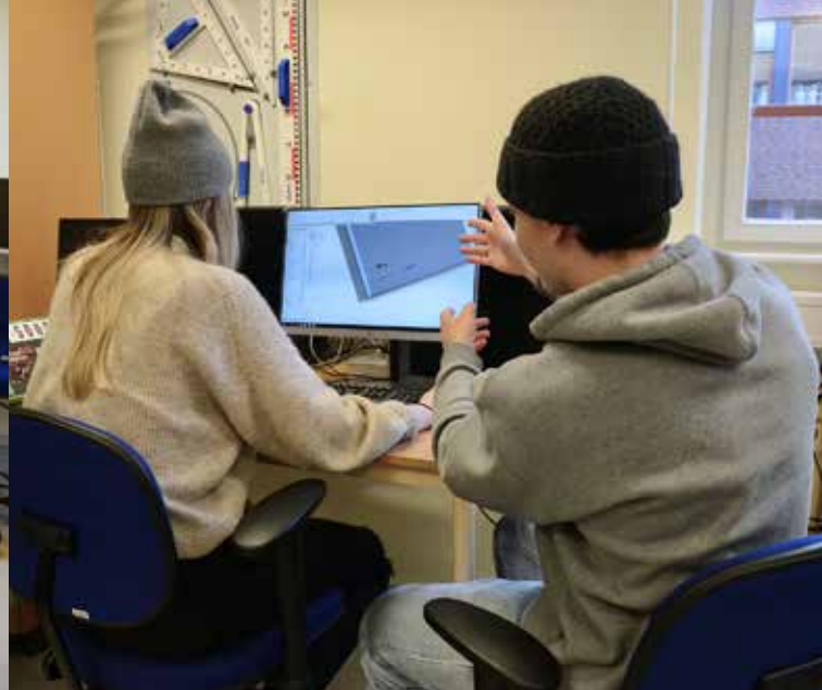
Samarbete vid datorn.

Den handlar om den byggda miljön och passar oss fint. Vi har t.ex. jobbat med Berga Äng , ett verkligt projekt här i Linköping. Eleverna har byggt modeller, ritat detaljplaner och försökt skapa det ideala området enligt bestämda detaljplaner.